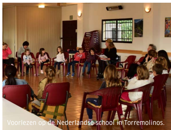
Voorlezen op de Nederlandse school in Torremolinos.