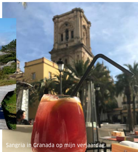
Sangria in Granada op mijn verjaardag.