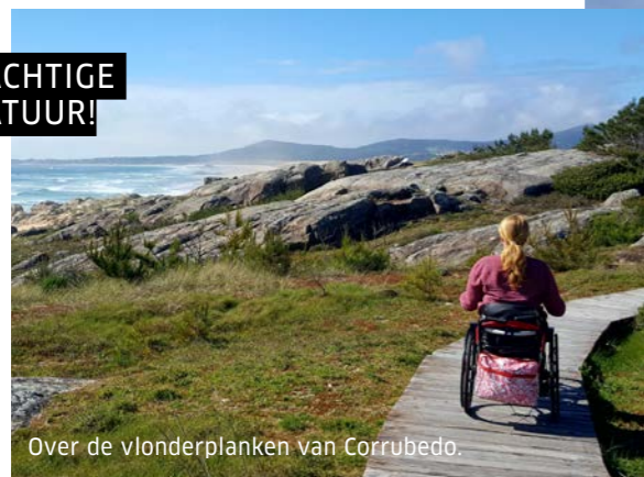
Over de vlonderplanken van Corrubedo.