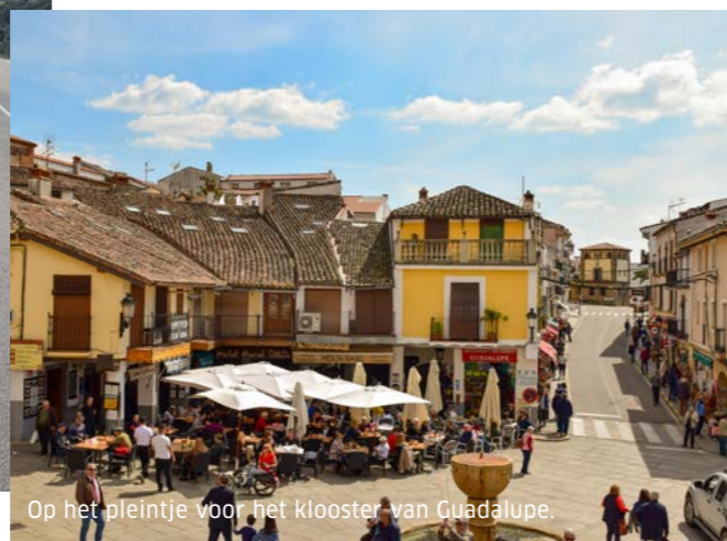
Op het pleintje voor het klooster van Guadalupe.